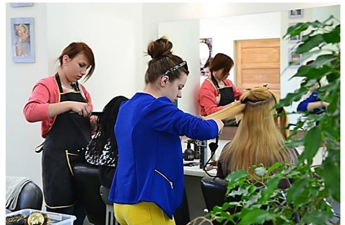
Zajęcia w szkolnej pracowni fryzjerskiej

W trakcie nauki w masz możliwość uzyskania dwóch kwalifikacji zawodowych: