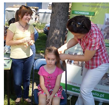
Plenerowe akcje charytatywne