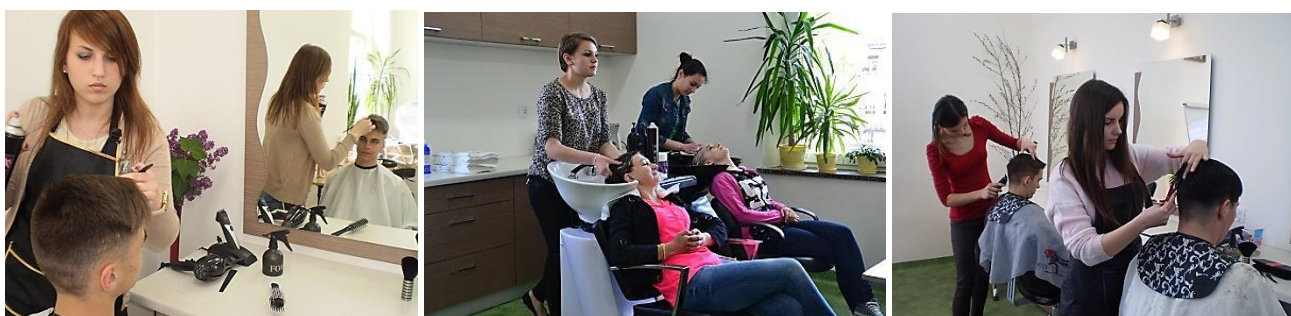
Uczniowie technikum usług fryzjerskich podczas zajęć w szkolnej pracowni fryzjerskiej

Zapraszamy Cię do zapoznania się z ofertą kształcenia w naszej szkole!