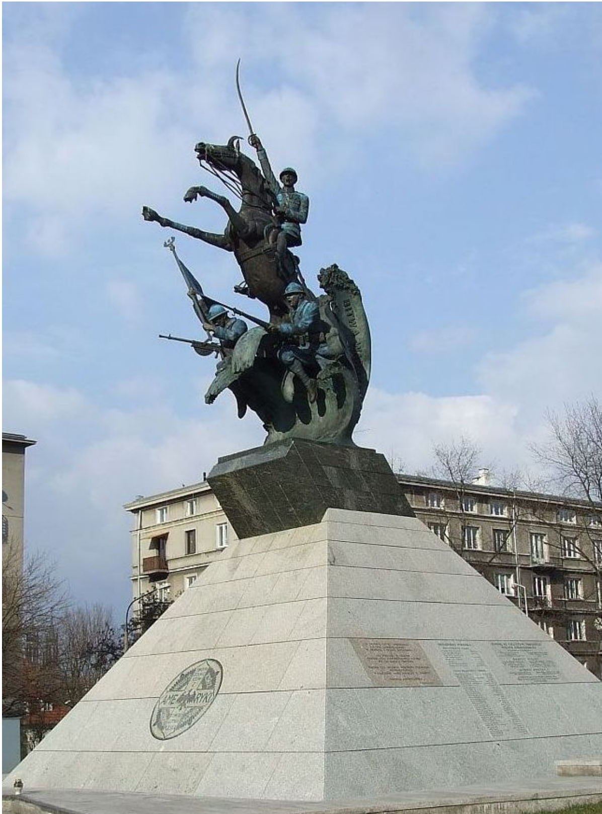
Pomnik Armii Błękitnej w Warszawie - dar Polonii Amerykańskiej dla Polski